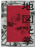
『地図と拳』 小川哲：著

「君は満州という白紙の地図に、夢を書きこむ」日本から密偵に帯同し、通訳として満州に渡った細川。ロシアの鉄道網拡大のために派遣された神父クラスニコフ。叔父にだまされ不毛の土地へと移住した孫悟空。地図に描かれた存在しない島を探し、海を渡った須野。奉天の東にある「李家鎮」へと呼び寄せられた男たち。「燃える土」をめぐり、殺戮の半世紀を生きる—。