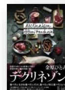
『デクリネゾン』 金原ひとみ：著