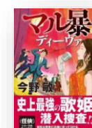
『マル暴ディーヴァ』 今野敏：著