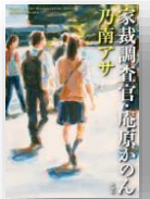
『家庭調査官・庵原かのん』 乃南アサ：著