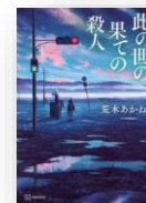
『此の世の果ての殺人』 荒木あかね：著