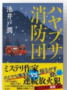
『ハヤブサ消防団』 池井戸潤：著