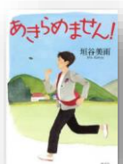
『あきらめません！』 垣谷美雨：著