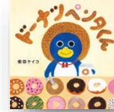
『ドーナツペンタくん』 柴田ケイコ：作