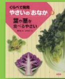
『葉や茎を食べるやさい』