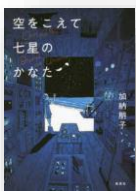
『空をこえて七星のかなた』 加納朋子：著