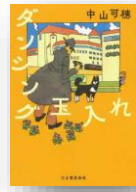
『ダンシング玉入れ』 中山可穂：著