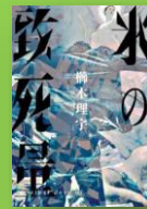
『氷の致死量』 櫛木理宇：著

中学教師の十和子は、自分に似ていたという女性教師が14年前に殺された事件に興味を持つ。彼女は自分と同じアセクシャル（無性愛者）かもしれない。一方、街では殺人鬼・八木沼が、また一人犠牲者を解体していた。二人の運命が交錯するとき、驚愕の真実が！『死刑にいたる病』の原作者が放つ、傑作シリアルキラー・サスペンス。