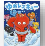
『ゆめレスキュー』 NOBU：作