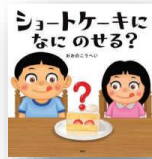
『ショートケーキになにのせる?』 おおのこうへい：作