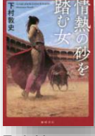
『情熱の砂を踏む女』 下村敦史：著