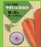
『根や豆を食べるやさい』