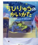
『ちびりゅうのかいかた』 せきやとしひろ：作