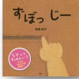
『ずぼっじー』 高橋祐次：作