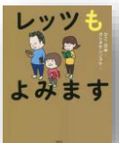
『レッツもよみます』 ひこ・田中：作