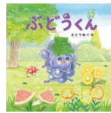
『ぶどうくん』 さとうめぐみ：作