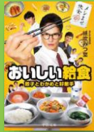
『餃子とわかめと好敵手』