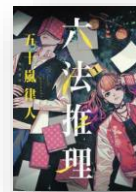
『六法推理』 五十嵐律人：著