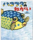
『ハコフグのねがい』 さかなクン：作