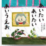
『あいたいあいたいあいうえお』 聞かせや。けいたろう：作