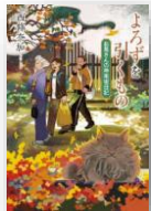
『よろずを引くもの』 西篠奈加：著