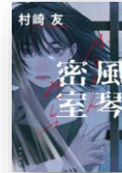
『風琴密室』 村崎友：著