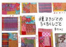
『種まきびとのちくちくしごと』 早川ユミ：作