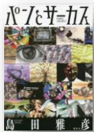
『パンとサーカス』 島田雅彦：著