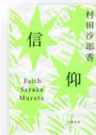
『信仰』 村田沙耶香：著