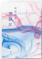
『禁猟区』 石田衣良：著