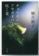
『チョウセンアサガオの咲く夏』 柚月裕子：著