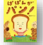
『ぱぱんがパン!』 柴田ケイコ：作