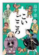
『こいごころ』 畠中恵：著