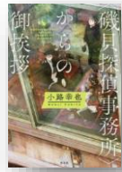
『磯貝探偵事務所からの御挨拶』 小路幸也：著