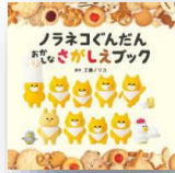
『ノラネコぐんだんいろいろさがしえブック』 工藤ノリコ：作