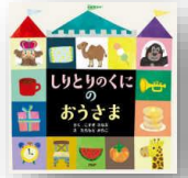
『しりとりのくのおうさま』 こすぎさなえ：作