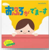
『おふろがでまーす』 accototo：作