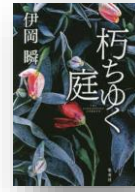
『朽ちゆく庭』 伊岡瞬：著