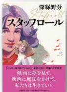
『スタッフロール』 深緑野分：著