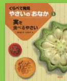
『実を食べるやさい』