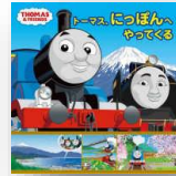
『トーマス、にっぽんへやってくる』 オードリー、ウィルバート：作