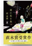
『夜に星を放つ』 窪美澄：著