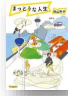
『まっとうな人生』 絲山秋子：著