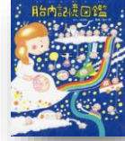
『胎内記憶図鑑』 のぶみ：作