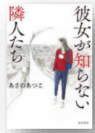
『彼女が知らない隣人たち』 あさのあつこ：著

中学教師の十和子は、自分に似ていたという女性教師が14年前に殺された事件に興味を持つ。彼女は自分と同じアセクシャル（無性愛者）かもしれない。一方、街では殺人鬼・八木沼が、また一人犠牲者を解体していた。二人の運命が交錯するとき、驚愕の真実が！『死刑にいたる病』の原作者が放つ、傑作シリアルキラー・サスペンス。