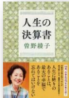
『人生の決算書』 曾野綾子：著