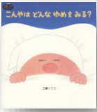
『こんやはどんなゆめをみる?』 工藤ノリコ：作