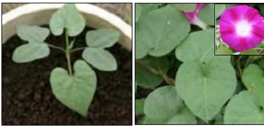
写真 マルバアサガオ(左:幼植物、右:本葉と花)

アレチウリや帰化アサガオ類等の防除が難しい雑草の発生が散見されます。発生を確認したら雑草の開花・結実前に速やかに防除し、拡大を防ぎましょう。