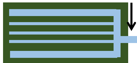
図2 明渠と排水口のつながり

図2のように明渠や排水口のつながりを確認し、圃場内に停滞水が発生しないようにする。